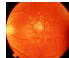
Slika 3. Suhi oblik

Suhi oblik je znatno češći i njegove karakteristične promjene su tzv. druze i gubitak (atrofija) pigmentnih ćelija mrežnice. Druze su sitne žućkaste nakupine ispod pigmentnih ćelija mrežnice zbog kojih dolazi do propadanja pigmentnih ćelija. Ukoliko su oštećene pigmentne ćelije, dolazi i do postupnog propadanja fotoreceptora s posljedičnim gubitkom centralnog vida.