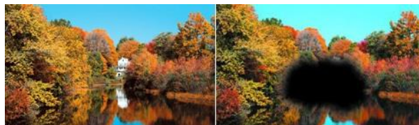
Slika 1. Centralni skotom - područje smanjenja ili gubitka oštrine vida, koje je okruženo poljem normalnog ili relativno dobro očuvanog vida.