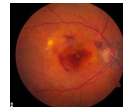
Slika 4. Vlažni oblik

Kod osoba sa suhim oblikom makularne degeneracije oštećenje vida je postupno i blaže, dok u osoba s vlažnim oblikom pad vida može nastupiti naglo i značajno smanjiti centralni vid.