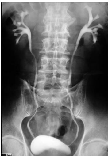
Primjer upotrebe kontrastnih sredstava u intravenskoj urografiji