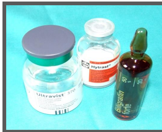
Primjerci kontrastnih sredstava

Najčešći načini su na usta (per os), intravenskom aplikacijom, aplikacijom u patološke otvore i td.